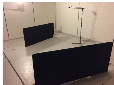
Fig. 2: Mätuppställning ScreenIT A30 1800 x 800 mm